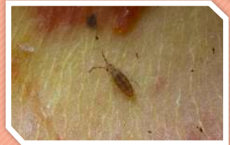
เพลี้ยไฟ

ตัวอ่อนและตัวเต็มวัยดูดกินน้ำเลี้ยงที่ยอดอ่อน ดอกอ่อน และผลอ่อน ทำให้ยอดแห้ง ผิวผลเป็นขี้กลาก