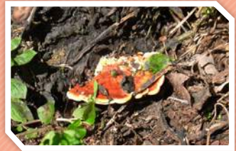
ลักษณะอาการ