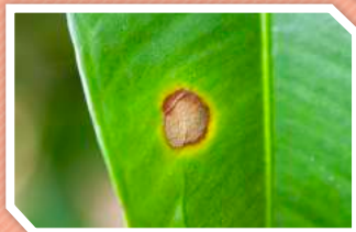
โรคใบจุดมังกุด

ใบเกิดเป็นรอยแผลไหม้สีน้ำตาล มีขอบแผลสีเหลือง รูปร่างของแผลไม่แน่นอน ทำให้ใบเสียพื้นที่ในการสังเคราะห์แสง ความสมบูรณ์ของต้นลดลง หากระบาดรุนแรงใบจะแห้งทั้งใบและร่วงหล่น ทำให้ผลมังกุดไม่มีใบปกคลุม ผิวของผลมังกุดจะกร้านแตกไม่สวย มักพบโรคใบจุดในช่วงฝนตกชุก ระยะใบอ่อนถึงเพลลาด