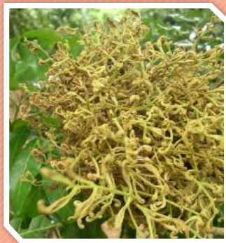
โรคพุ่มไม้กวาด

ใบยอดแตกใบออกเป็นฝอย มีลักษณะเหมือนพุ่มไม้กวาด ใบมีขนาดเล็กเรียวยาว ใบแข็งกระด้าง ไม่คลี่ออก เป็นกระจุกสั้นๆ ขึ้นตามส่วนยอด หากยอดที่เป็นโรคเมื่อถึงคราวออกช่อดอก ถ้าไม่รุนแรงก็จะออกช่อชนิดติดใบปนดอก และช่อสั้นๆ ซึ่งอาจติดผลได้ 4 - 5 ผล ถ้าเป็นโรครุนแรง ดอกลำไยจะเป็นฝอย มีใบชนิดไม่คลี่อยู่มาก ลำไยที่เป็นโรครุนแรงต้นจะโทรม ออกดอกติดผลน้อย