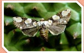
ตัวเต็มวัย