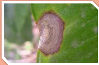
ลักษณะอาการ