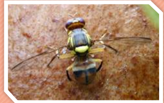
ตัวเต็มวัย

แมลงวันผลไม้วางไข่ในผลไม้ที่ใกล้สุกและมีเปลือกบาง เพศเมียใช้อวัยวะวางไข่แทงเข้าไปในผลไม้