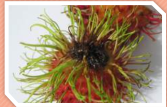
ลักษณะการทำลาย