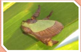
ตัวเต็มวัย