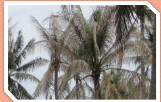
ลักษณะการทำลาย