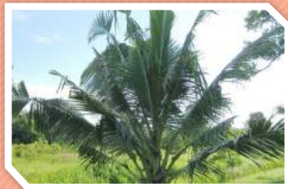
ลักษณะการทำลาย