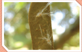
ตัวเต็มวัยเพศเมีย

แมลงชนิดนี้ทั้งตัวอ่อนและตัวเต็มวัยดูดกินน้ำเลี้ยงจากใบอ่อนของทุเรียนที่ยังไม่โตเต็มที่ ทำให้ใบอ่อนเป็น