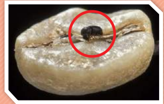
มอดเจาะผลกาแพ

เป็นแมลงปีกแข็งสีดำขนาดเล็ก กว้าง 1 มิลลิเมตร และยาว 2 มิลลิเมตร ทำความเสียหายให้กับผลกาแพ โดยการเจาะผลกาแพเข้าไปกัดกินเนื้อผลกาแพ และวางไข่ ขยายพันธุ์อยู่ภายในได้ตั้งแต่ผลกาแพมีขนาด 0.5 เซนติเมตร จนถึงระยะสุกแก่ เมื่อมีการเก็บเกี่ยวกาแพ มอดที่อาศัยอยู่ภายในผลจะตามไปทำลายได้ที่ลานตาก นอกจากนี้มอดยังใช้ผลกาแพที่หลงเหลือจากการเก็บเกี่ยวเป็นแหล่งอาศัย ข้ามฤดูด้วย