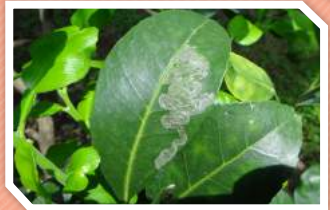
หนอนชอนใบส้ม

ตัวเต็มวัยเป็นผีเสื้อกลางคืนขนาดเล็กมาก ลำตัวมีสีน้ำตาลปนเทา ปีกสีเทาเงิน และมีจุดสีดำบริเวณขอบปีก ผีเสื้อจะวางไข่เป็นฟองเดี่ยวๆ ใกล้เคียงเส้นกลางใบ ไข่จะฟักภายใน 3 - 5 วัน ระยะหนอน 8 - 10 วัน ระยะดักแด้ 5 - 10 วัน