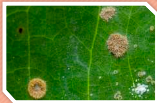
โรคใบจุดสาหร่ายทุเรียน

พบโรคนี้ทั้งที่ใบและกิ่ง อาการบนใบจะเป็นจุดเล็กๆ นูนขึ้นจากผิวใบเล็กน้อย ขอบของจุดมีลักษณะเป็นแฉกๆ ไม่เรียบ สีค่อนข้างเขียวปนเทา จุดเล็กๆ นี้จะขยายใหญ่ขึ้นในสภาพความชื้นสูงและได้รับแสงแดดเพียงพอ เมื่อสาหร่ายแก่ขึ้นจะเปลี่ยนเป็นสีน้ำตาลแดง ซึ่งเป็นระยะที่สร้างอวัยวะสืบพันธุ์เพื่อแพร่ไปยังส่วนอื่นๆ ของต้นทุเรียนได้อีก อาการจุดบนใบนี้ไม่ค่อยทำความเสียหายให้มากนัก