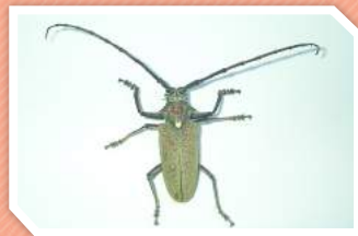
ตัวเต็มวัย