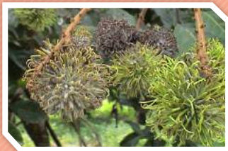
ลักษณะอาการ