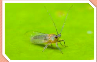
ตัวเต็มวัยเพศผู้