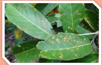
ลักษณะอาการ