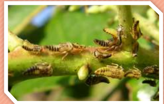
ลักษณะการทำลาย