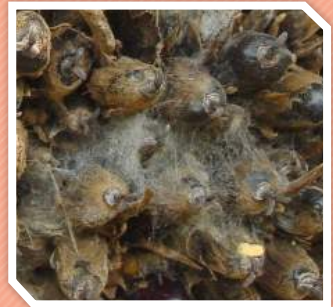
โรคทะลายเน่าปาล์มน้ำมัน

ทำลายผลปาล์มน้ำมันก่อนที่จะสุก ระบาดมาก ในฤดูฝน ที่มีความชื้นสูง ในระยะแรกพบเส้นใยสีขาวของเชื้อราบนทะลายปาล์มน้ำมัน บริเวณช่องระหว่างผล และโคนทะลายส่วนที่ติดทางใบ ต่อมาเส้นใยขึ้นปกคลุมทั้งทะลาย เกิดอาการผลเน่าเป็นสีน้ำตาล หากทะลายยังคงติดอยู่บนต้นผลจะแสดงอาการเน่าแห้งและมีเชื้อราชนิดอื่นๆ เข้าทำลายภายหลังได้ ในแปลงที่