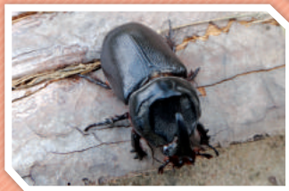
ตัวเต็มวัย

ตัวเต็มวัยลำตัวมีสีน้ำตาลแดงเกือบดำ มีขนสีน้ำตาลอ่อนที่ด้านข้างของส่วนหัว ออก ขา และด้านล่างของลำตัว ตัวผู้มีเขาคล้ายนอแรดที่ส่วนหัวค่อนข้างยาว ตัวเมียมีลักษณะคล้ายตัวผู้แต่มีเขาสั้นกว่า และที่ส่วนปลายของท้องด้านล่างมีขนเยอะกว่าตัวผู้ และมีขนาดใหญ่กว่าตัวผู้ไม่มาก ตัวเมียวางไข่ในกองเศษซากใบมะพร้าว และฟักเป็นตัวหนอนก็จะเจริญเติบโตอยู่ในดิน หนอนมีสีขาวนวล ส่วนหัวเป็นสีเหลืองปนน้ำตาล