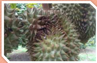
ลักษณะการทำลาย