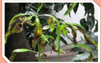
ลักษณะอาการที่ใบ

เชื้อราสามารถเข้าทำลายได้เกือบทุกส่วนของมะม่วง ไม่ว่าจะเป็นต้นกล้า ยอดอ่อน ใบอ่อน ช่อดอก ดอก ผลอ่อน ผลแก่ และผลแก่หลังการเก็บเกี่ยว เริ่มแรกจะเป็นจุดเล็กๆ และขยายออกเป็นวงขนาดต่างๆ กัน บริเวณกลางแผล จะเห็นเม็ดสีดำๆ หรือสีส้มปนบ้างเรียงเป็นวงอยู่ภายในแผล หากการเข้าทำลายรุนแรงก็จะเกิดอาการใบแห้ง บิดเบี้ยว และร่วงหล่น ช่อดอกแห้งไม่ติดผล ผลเน่าร่วง ตลอดจน ผลเน่าหลังการเก็บเกี่ยว