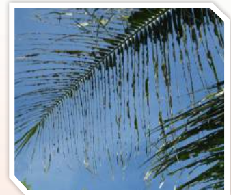
ลักษณะการทำลาย