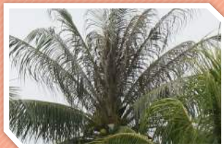
ลักษณะการทำลาย