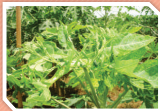
โรคใบด่างจุดวงแหวน