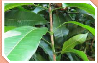
ลักษณะอาการที่กิ่ง