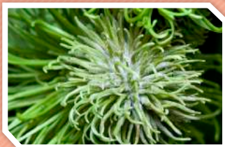
โรคราแป้งเงาะ

ราแป้งทำลายเงาะได้ทุกระยะการเจริญเติบโต แต่อาการรุนแรงและความเสียหายเกิดที่ผลอ่อน อาการที่สังเกตเห็นได้ คือ ใบอ่อน ช่อดอก ผลอ่อน จะมีผงฝุ่นแป้งปกคลุมอยู่ ทำให้ผลอ่อนร่วง ในระยะผลโต ถ้าเป็นโรคนี้อาจทำให้ผลสุกปรกและเกิดอาการเงาะขนเกรียนหรือกุดสั้น ขายไม่ได้ราคา มักระบาดในช่วงอากาศเย็นและชื้น ราจะขึ้นปกคลุมผิวของพืชและสร้างอวัยวะคล้ายรากแทงเข้าไปดูดกินน้ำเลี้ยงภายในพืช