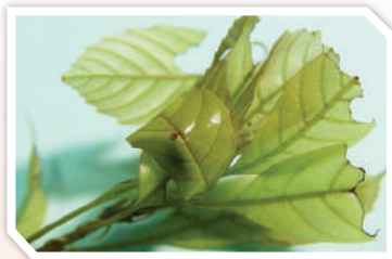
ลักษณะการทำลาย