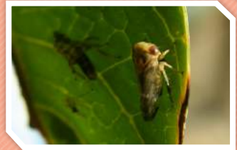
ตัวเต็มวัย

เพลี้ยจักจั่นที่พบระบาดมี 2 ชนิด ลำตัวมีสีเทาปนดำ หรือน้ำตาลปนเทา ลำตัวยาว 5.5 - 6.5 มิลลิเมตร เพศเมียวางไข่ตามแกนกลางใบอ่อนหรือก้านช่อดอก ระยะไข่ 7 - 10 วัน ตัวอ่อนลอกคราบ 4 ครั้ง จึงเป็นตัวเต็มวัย ระยะตัวอ่อน 17 - 19 วัน