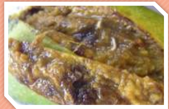
ลักษณะการทำลาย