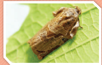
ตัวเต็มวัย