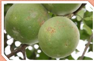
ลักษณะอาการที่ผล

เกิดได้ทั้งที่ใบ กิ่ง ก้าน และผลส้ม มีลักษณะอาการเกิดเป็นจุดกลม และฉ่ำน้ำ มีสีเหลืองซีดหรือเขียวอ่อน เมื่อขยายใหญ่ขึ้นมีลักษณะฟูคล้ายฟองน้ำสีเหลืองอ่อน ต่อมาจะเปลี่ยนเป็นสีน้ำตาลเข้มแตกสะเก็ดขรุขระ หนูน และแข็ง ตรงกลางเป็นรอยบุ๋มมีวงสีเหลืองล้อมรอบแผล โรคนี้จะระบาดรุนแรงเมื่อสภาพแวดล้อมเหมาะสม แพร่ระบาดโดยเชื้อติดไปกับกิ่งพันธุ์ ดิน และน้ำ