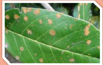
โรคใบจุดสาหร่ายเงาะ

โรคนี้อาจเกิดขึ้นได้ที่ใบและกิ่ง แต่ความเสียหายเกิดขึ้นมากเมื่อเป็นที่กิ่ง อาการบนใบจะเห็นเป็นจุดหรือดวงสีเทาอ่อนปนเขียว ต่อมาจะเปลี่ยนเป็นสีแดงสนิมเหล็ก ลักษณะคล้ายกำมะหยี่ ทำให้ลดพื้นที่สังเคราะห์แสงของใบ อาการบนกิ่งหรือลำต้น จะคล้ายกับอาการที่เกิดบนใบทำให้ผิวเปลือกเสียและอาจแตกกร่อน เชื้อสามารถแพร่ระบาดโดยสปอร์ปลิวไปตามลม จะระบาดในฤดูฝน หรือในแหล่งที่มีความชุ่มชื้น