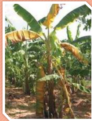
โรคตายพรายกล้วย

ใบมีอาการขาดน้ำ ใบอ่อนจะมีอาการเหลืองไหม้หรือตายนิ่งและบิดเป็นคลื่น โคนใบแก่ด้านนอกมีสีเหลืองซีด และผืนใบเปลี่ยนเป็นสีน้ำตาลโดยเริ่มจากขอบใบเข้าสู่กลางใบ และใบหักพับภายใน 1 - 2 สัปดาห์ และยืนต้นตายในที่สุด เมื่อผ่าลำต้นจะพบเนื้อในเป็นสีน้ำตาลแดง กล้วยที่ตกเครือแล้วจะเหี่ยว ผลเล็กลีบหรือแก่ก่อนกำหนด ซึ่งทำให้ได้ผลผลิตที่ไม่มีคุณภาพ