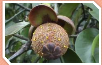
ลักษณะการทำลายที่ผล