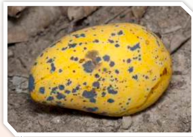
ลักษณะอาการที่ผล