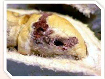
ลักษณะการทำลาย

เข้าไปภายในผล เจาะไซเข้าไปกักกินเมล็ด และถ่ายมูลออกมา ทำให้เนื้อทุเรียนเปรอะเปื้อนเสียหาย หนอนอาศัยในผลทุเรียนจนกระทั่งผลแก่ เมื่อหนอนโตเต็มที่หรือถ้าผลร่วงก่อน จะเจาะรูออกมาเข้าดักแต่ในดิน