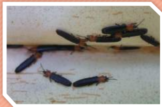
ตัวเต็มวัย

ตัวเต็มวัยเพศเมียวางไข่ในเวลากลางวัน โดยวางเป็นฟองเดี่ยวหรือเป็นกลุ่มภายในใบมะพร้าวที่ยังไม่คลี่ออก ตัวหนอนของแมลงดำหนามมะพร้าวมี 4 วัย จึงเข้าดักแด้ ตัวเต็มวัยของแมลงดำหนามมะพร้าว ลำตัวมีสีดำ หัวและอกมีสีส้ม อาศัยกัดกินใบมะพร้าว อยู่ระหว่างใบหรือภายในใบมะพร้าวที่ยังไม่คลี่ออก