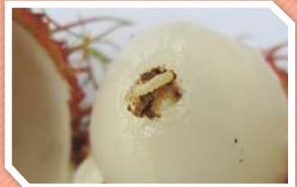
ตัวหนอนและลักษณะการทำลาย

ตัวเต็มวัยเป็นผีเสื้อกลางคืนขนาดเล็ก ตอนกลางวันอาศัยอยู่ตามต้นพืชอาหาร เพศเมียวางไข่ที่ผลเงาะ ไข่มีลักษณะกลมรี เมื่อหนอนฟักออกมาจากไข่จะเจาะและเข้าไปในผล ตัวหนอนมีสีขาว หัวสีน้ำตาลอ่อน ระยะหนอนประมาณ 14 - 18 วัน ก็จะเข้าดักแด้โดยไต่ออกมาจากผลและหาที่ที่เหมาะสมเข้าดักแด้ ระยะดักแด้ 6 - 8 วัน