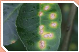
ลักษณะอาการที่ใบ