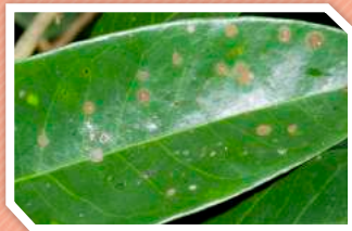
ลักษณะอาการ