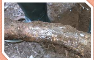
โรครากขาว

เชื้อโรคสามารถเข้าทำลายต้นยางได้ทุกระยะการเจริญเติบโต ตั้งแต่อายุ 1 ปีขึ้นไป เมื่อระบบรากถูกทำลายจะแสดงอาการให้เห็นที่ทรงพุ่ม ซึ่งเป็นระยะที่รุนแรงและไม่สามารถรักษาได้ บริเวณรากที่ถูกเชื้อเข้าทำลายจะปรากฏเส้นใยสีขาวเจริญแตกสาขาปกคลุม เกาะติดแน่นกับผิวยาง เมื่อเส้นใยอายุมากขึ้น