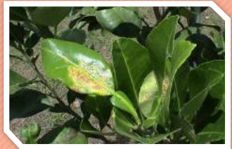
ลักษณะการทำลาย